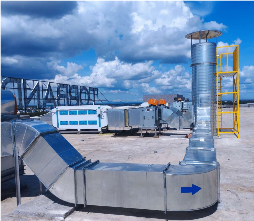
LẮP ĐẶT SÀN THAO TÁC VÀ CẢI TẠO ỐNG THOÁT KHÍ CĐT: CÔNG TY TNHH TOPBAND SMART VIỆT NAM Địa điểm: Đồng Nai